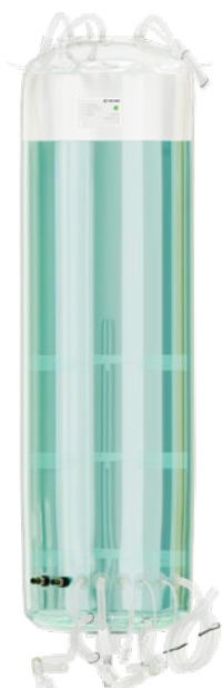
eBAG 3D STR 100L - 1000L

La eBAG 3D STR está diseñada para una integración sin problemas con nuestros biorreactores SU . Fabricadas en una sala blanca ISO7, estas bolsas aseguran esterilidad y están disponibles en tamaños desde 100 hasta 1000 litros, cubriendo un amplio espectro de necesidades de bioprocesamiento.